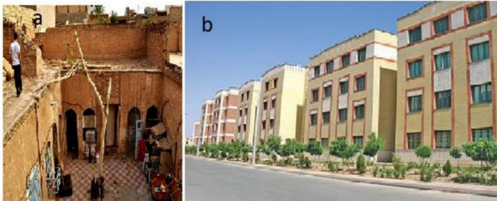
شکل شماره ۲: a: قرارگیری ساختمان در بافت قدیم ، b بافت جدید شهر ماهشهر

مقارنة بين معشور القديمة يسارا ومعشور الصناعية يمينا