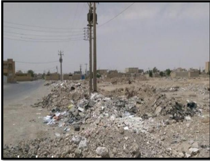
مشهد من معشور القديم حي سكني عربي 37