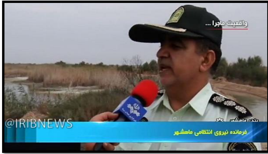
قائد شرطة معشور عند موضع مجزرة الجراحي

أكد وزير الداخلية الإيراني عبد الرضا رحمانى فضلي في 5 ديسمبر لاحقا (أن المتظاهرين قاموا بإغلاق طريق ماهشهر إلى ميناء الإمام الخميني لمدة ثلاثة أيام، وأن المحتجين قد تحصنوا وفي أثناء التحصين أطلقوا الرصاص الرشاش [مدفع رشاش تمهيل!! 27 ]. ويقول عبد الله جانجي الرئيس التنفيذي للصحيفة جوان (=تابعة للحرس الثوري الإرهابي) في الافتتاحية 5 ديسمبر أن (طريق معشور - جام ، الذي يربط بين مقاطعتي خوزستان [الأحواز] وبوشهر، كان مسلحا لمدة أربعة أيام ومغلقا 28 ). ومن خلال رصد ما نشر من وثائق مرئية وصور يظهر أن الاحتجاجات كانت سلمية وأن إشهار السلاح لم يكن مشهود وهذا يعني أن كذب مسؤولي النظام واضح لتمويه الحقيقة 29 .