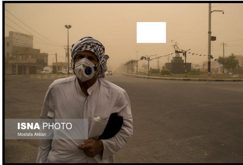
مواطن عربي من معشور 39