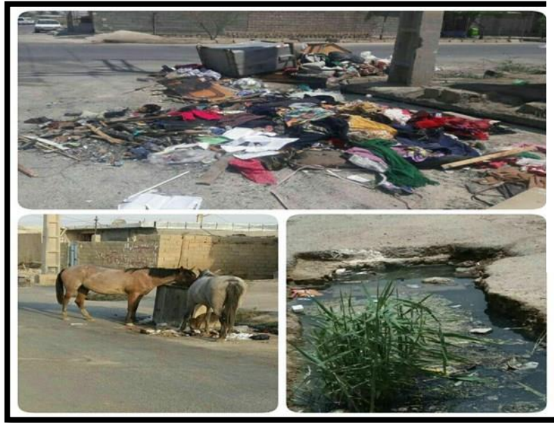
مشاهد من معشور القديمة بسكانها العرب 38