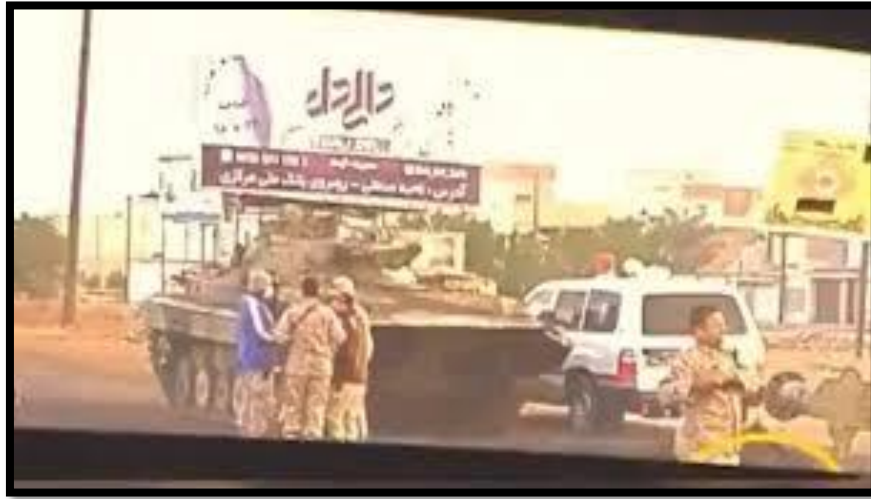
الدبابات التي دخل معشور لقمع المواطن المعشوري

وقد أجرت صحيفة نيويورك تايمز تقريراً شاملاً عن الانتفاضة في معشور أكدت ما حدث من أحداث دامية ارتكبتها النظام الإيراني بحق السكان عن كيفية نشر الحرس الثوري قوة كبيرة في ماهشهر يوم الاثنين 18 نوفمبر لسحق الاحتجاجات على مدار ثلاثة أيام وفقاً لشهود عيان نجح المحتجون في السيطرة على معظم معشور وضواحيها إغلاق الطريق الرئيسي المؤدي إلى المدينة ومجمع البتروكيماويات الصناعي المجاور وأشارت أن الحكومة الإيرانية لم ترد على أسئلة محددة في الأيام الأخيرة حول عمليات القتل الجماعي في المدينة 11 . وقالت صحيفة واشنطن تايمز نقلاً عن خارجية الولايات المتحدة (لقد حاصر جنود الحرس الثوري الإيراني بقيادة الجنرال شاهفاربور المتظاهرين بالعربات المدرعة ، ثم بدأوا في إطلاق الرشاشات على الحشد ما أدى إلى قتل نحو 150 محتجاً في جنوب غرب إيران. وقال مسؤولون آخرون في وزارة الخارجية الأمريكية إنه عندما قام بعض المتظاهرين بتغطية مكانهم في مستنقع قريب ، أشعله الحرس الثوري الإيراني 12 ).